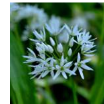
Foto nell'ordine: Rana di Lataste, scorcio su Laghetto grande, ferrovia Como-Milano, aglio orsino.