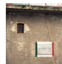
Faro Voltiano e vista dal Faro - Orologio nella Funicolare - Targa sulla casa (presunta) dove Volta è stato a balia.