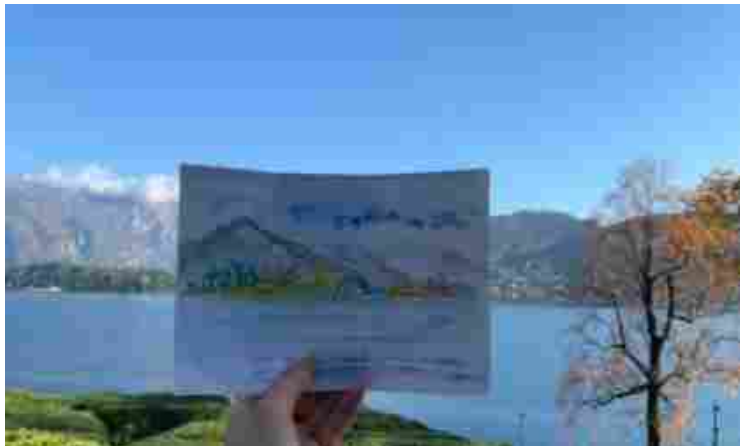
CULTURA Lago, 28 Aprile 2022 ore 15:08

Si inaugura il 6 maggio la mostra diffusa Trame Lariane – Trame d’Arte e Moda a Villa Carlotta, Giardini di Villa Melzi d’Eril e Villa Monastero