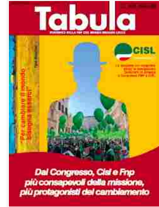
PERIODICO DELLA FNP CISL MONZA BRIANZA LECCO