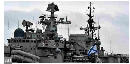
L'Ucraina ha colpito un'altra nave russa nel Mar Nero