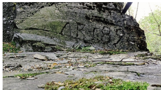
Prima pietra di Castel d'Ardona: la foto premiata di Mario Marinoni