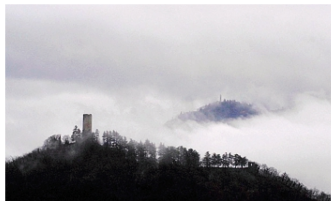
Il Baradello d'inverno: scatto vincitore di Laura Piatti